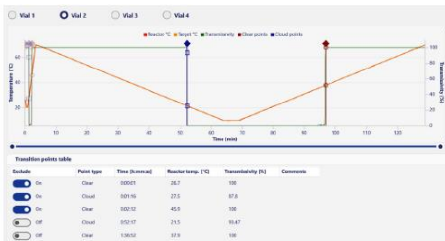
図6 測定結果：各バイアルの温度、透過率及び検出された Clear Point、Cloud Point。