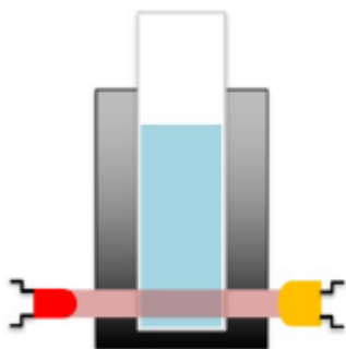
図1 Crystal16 シリーズの透過率測定イメージ図：バイアル底部に赤色 LED レーザーを照射し、試験液中の透過率を記録する。

Technobis 社(オランダ)が2022年にリリースした Crystal16V3 は、「溶液を直接測定」しながら晶析操作を行い、溶解度測定を容易に行うことができる装置として知られる Crystal16 の後継機である。Crystal16 と同様に、溶液中の透過率をモニタリングすることにより、結晶の析出や溶解を検出する。