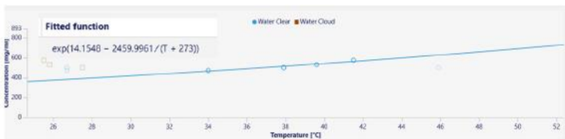
図7 溶解度曲線：Clear Point から Van't Hoff fitting により計算された溶解度曲線及び計算式。 同様に Cloud Point から過溶解度曲線、2本の曲線から準安定領域を決定することができる。