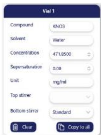
図3 バイアル情報の入力例

2-2. 試験名称、試験担当者等の基本情報を入力したのち、各バイアルの情報を入力した(図3)。