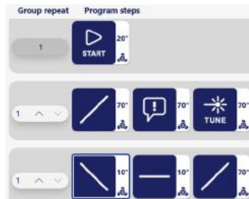
図4 試験プログラムの例：試験開始後、70°Cに昇温して試料を全溶解させ、Tune ※2 (Tune操作時の透過率を100%に調整する操作)を行い、温度を10°Cに降下させ結晶を析出させ、その後70°Cに昇温し溶解させるプログラム ※3 。

※2：Tuneは必須ではありません。Tuneを実行しない場合、標準の透過率校正値(空气中で透過率を100%に校正した値)が適用されるため、Tuneを行う場合よりも検出感度が低くなります。