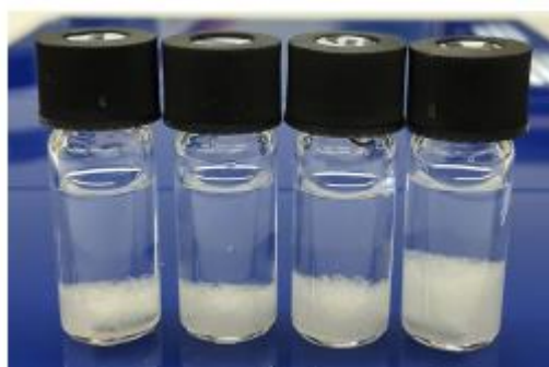
図2 調製した試料：硝酸カリウム(KNO 3 )をバイアルに秤取し、1mLの精製水を加え、Stirrer barを入れ、キャップを閉めた状態。