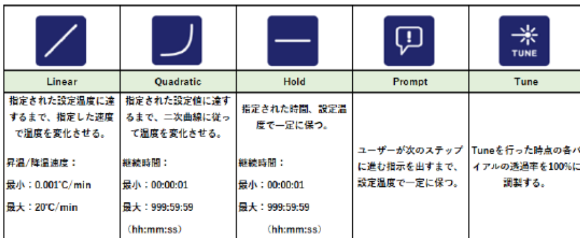
表1 各プログラムの説明